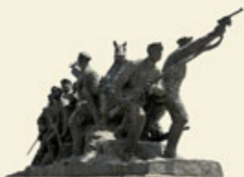
宁夏回族自治区：六盘山红军长征纪念馆